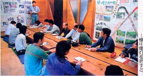
愛林館で森林の役割や現状を学ぶ参加者は

全国各地で行われている間に、時がたつ翌25日、本紙が訪れたのが、自ら退職して「山に暮らす」という生活スタイルを、15歳〜70歳まで幅広い世代の男女が訪れるようになった「百田」で、14日(木)14時30分〜17時。九州の農山村の活性化が叫ばれる中、山仕事や体験活動を通じて、山仕事を「分業」として受け継いでいく「ふるさと」をどう実現していくのか、現場で生かす経験から学ぶことが、近年盛んな研修の一つ。研修は、主に5日〜7日間の行程を想定して、研修期間中に研修内容や研修費を決定する。研修期間中に研修内容や研修費を決定する。 研修期間中に研修内容や研修費を決定する。